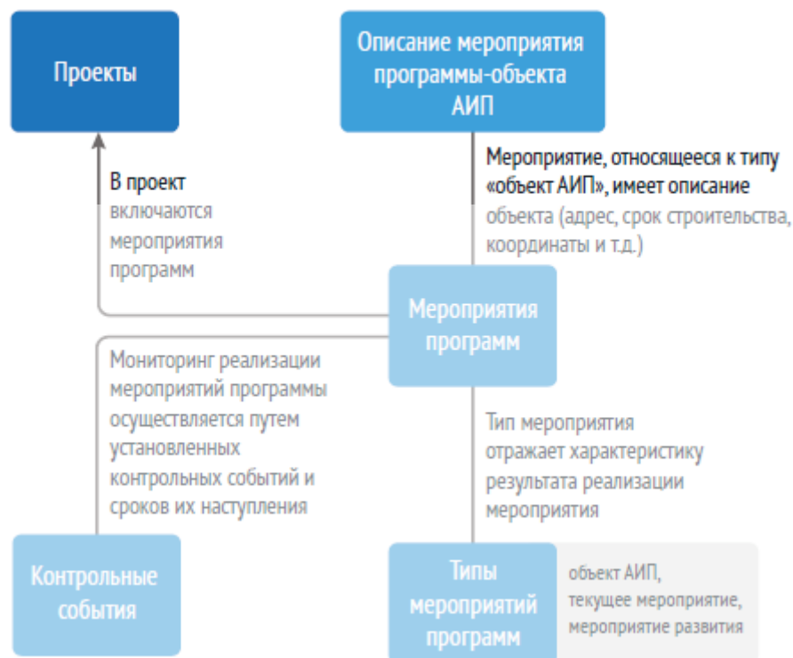
Рисунок 2. - Интеграция проектов в процесс управления государственными программами

У каждого мероприятия государственной программы устанавливается тип, который отражает характеристику результата реализации мероприятия: объект АИП, текущие мероприятия, мероприятия развития.