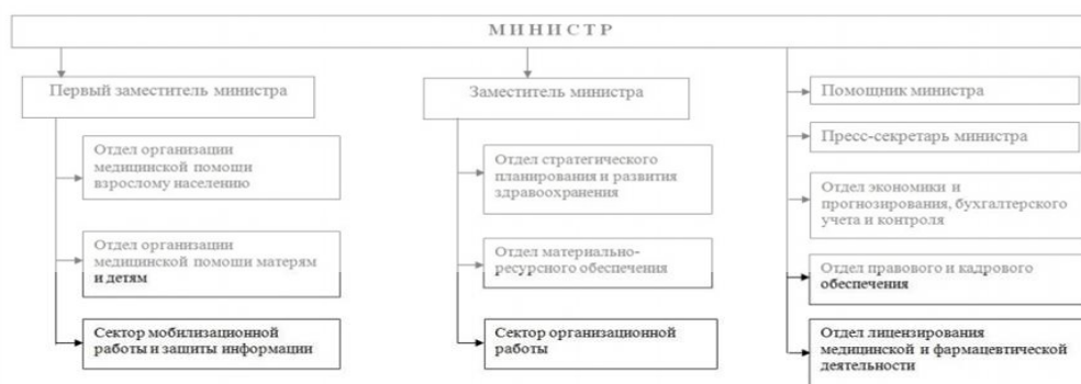
Рисунок 1. - Организационная структура Министерства здравоохранения Республики Башкортостан

Организационная структура Министерства здравоохранения Республики Башкортостан представлена на рисунке 1.